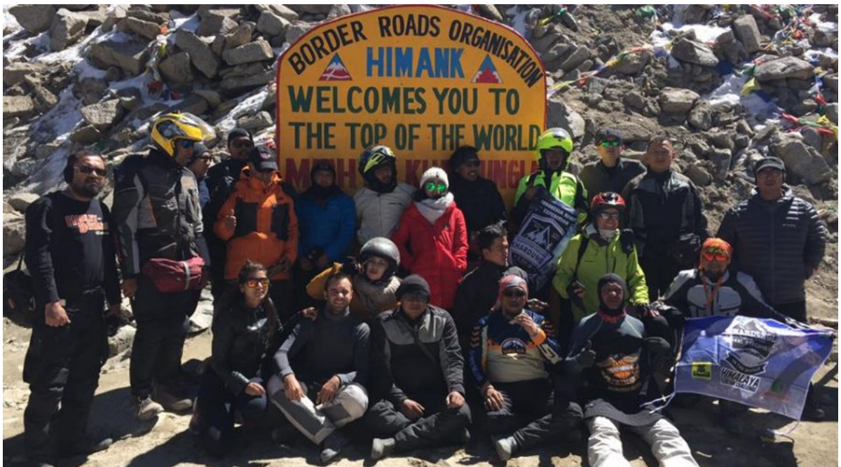
5600 M KHardungla

Anda tiba di Jakarta siang hari setelah sebelumnya anda akan transit di Swarnabumi - Thailand